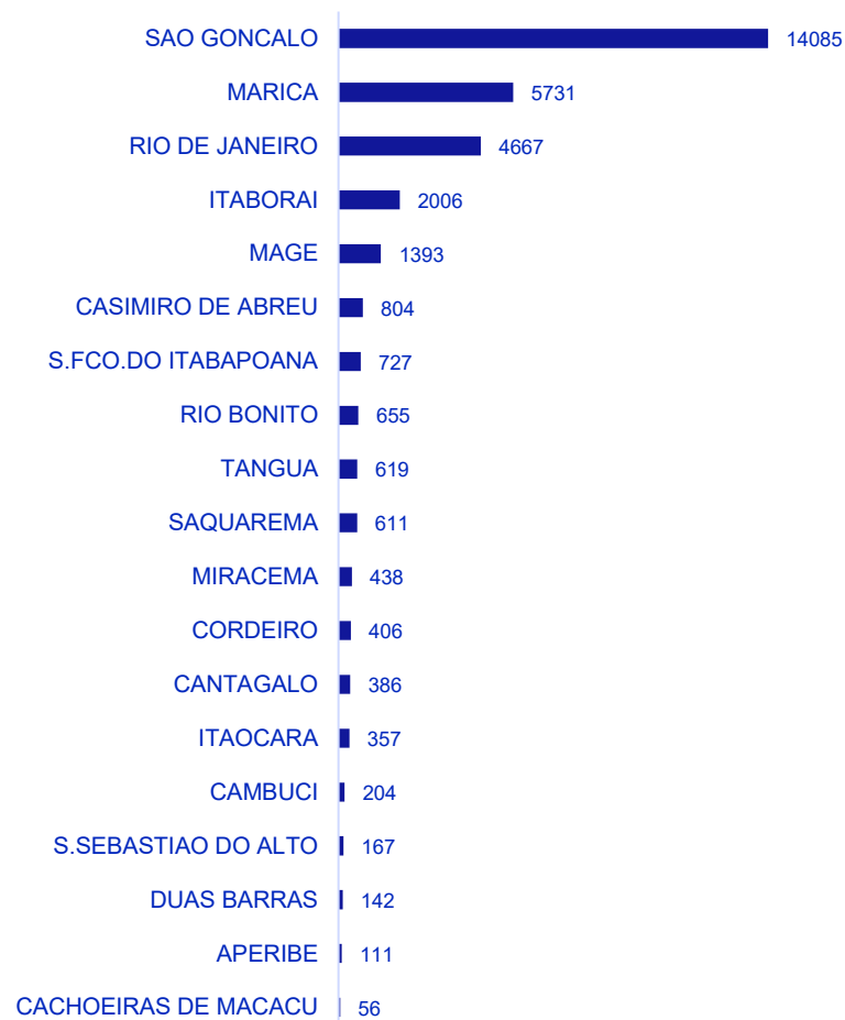
Volumetria nas Regiões Geográficas - Município