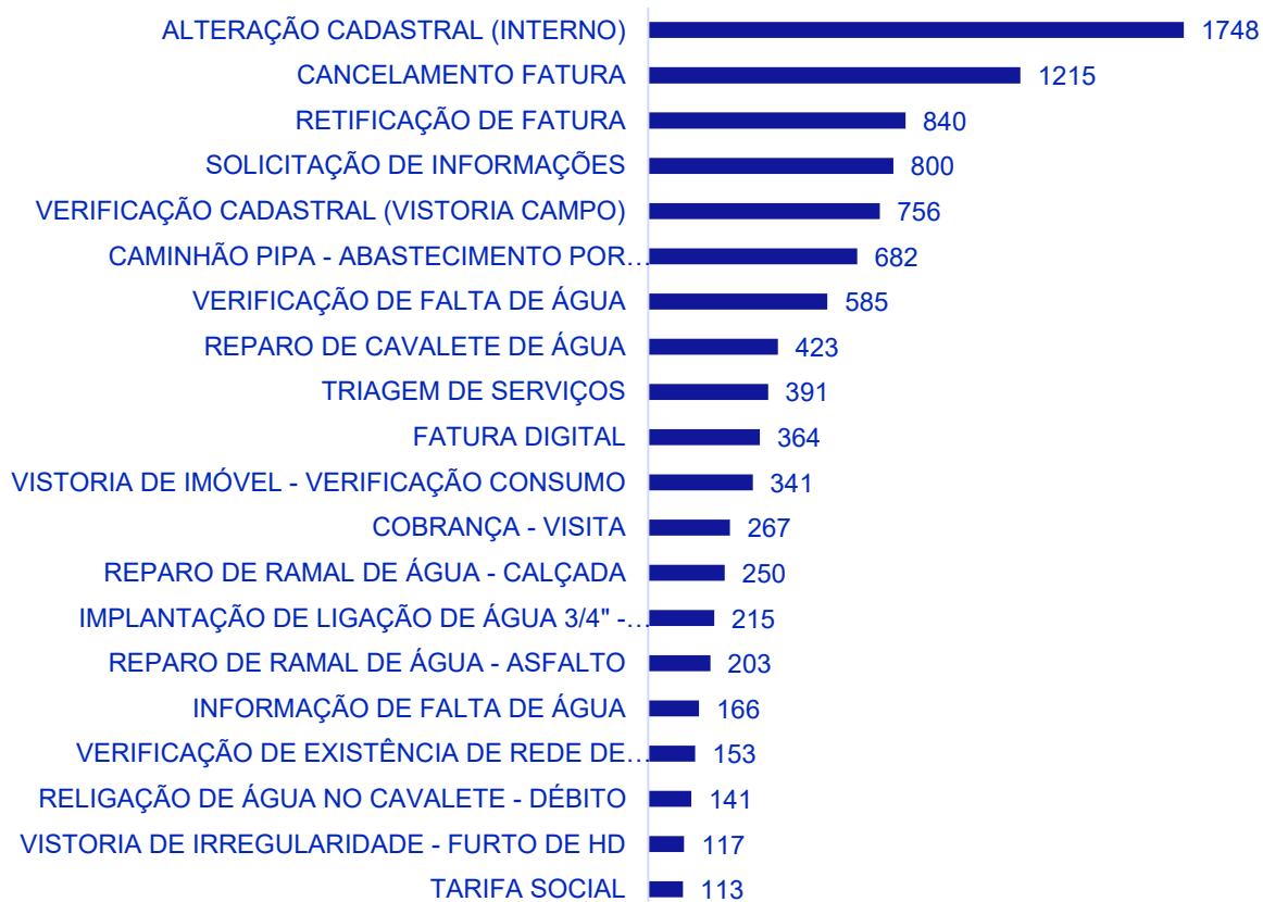
Top 20 Serviços Solicitados

Art. 62. A cada trimestre as Reguladas deverão enviar à Ouvidoria da AGENERSA relatório estatístico detalhado com aponte do número de usuários atendidos, regiões geográficas, municípios e bairros, número e percentual de casos solucionados e espécies de demandas recebidas