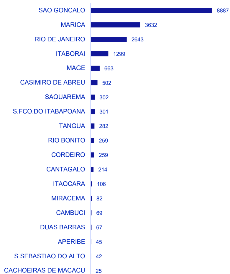
Volumetria nas Regiões Geográficas - Município